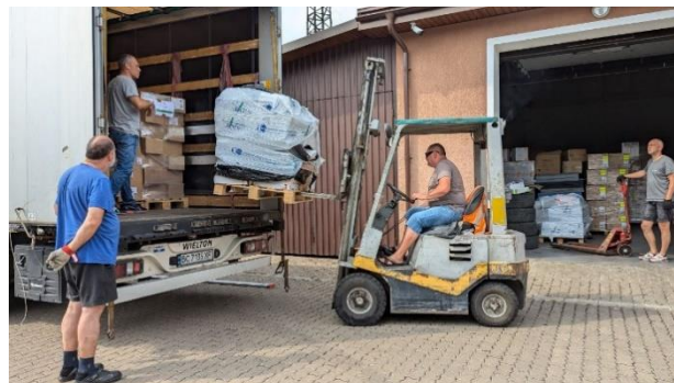
Arrivée d'un camion de SAFE en Ukraine Juillet 2024