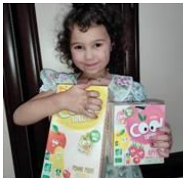
Distribution de nourriture Juillet 2024

Enlèvement dans toute la France et en Europe. Les dons en nature sont déductibles des impôts.